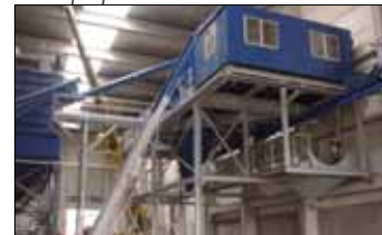
Installatie ter plaatse