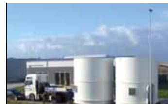
Grote projecten behoren tot corebusiness

We vallen ongetwijfeld in herhaling, maar zoals algemeen geweten is, is het vinden van geschikt, technisch geschoold personeel hét heikel punt in de volledige industriële sector. Ook hier is dat niet anders. Om een volledige bezetting van de werkplaats mogelijk te maken, is men op zoek gegaan naar de meest geschikte