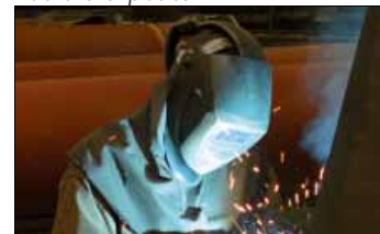
VCA-certificaat is een garantie voor veiligheid, ook bij het lassen

arbeidskrachten. “Hiervoor hebben we ook over de grenzen heen moeten kijken. Zo hebben we twee arbeiders met Poolse nationaliteit in dienst, we konden niet anders. Communiceren verloopt enigszins moeilijk, maar het zijn vakmensen die niet veel woorden nodig hebben om toch uitstekende resultaten te leveren”.